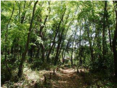
市街地に隣接した雑木林、茶畑、草地等が組み合わさった地域です。