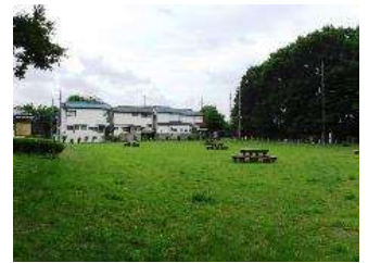
地域北西は広場になっており、開放的な空間になっています。