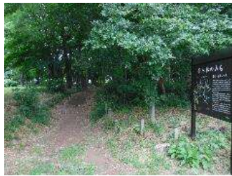
散歩コースである「雑木林のみち」の順路にもなっています。