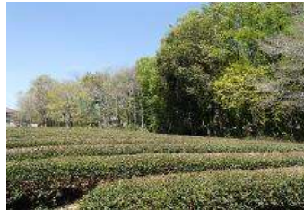
茶畑が広がる珍しい保全地域です。