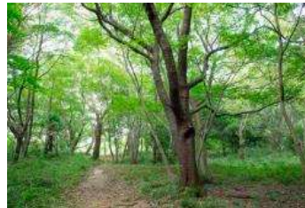
町田市の中央に位置する 緑豊かな里山です。