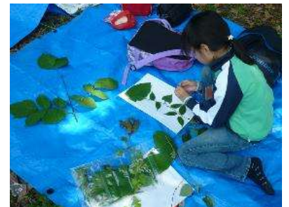
お子さんには工作等のプログ ラムもご用意できますよ♪