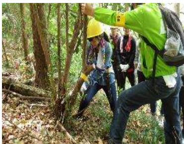
樹木や竹の伐採を体験します。