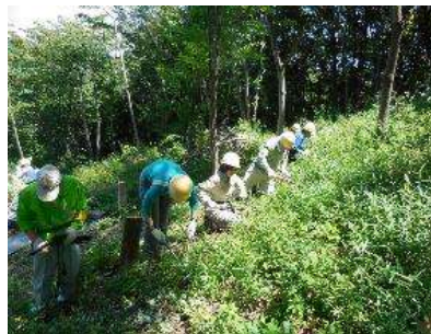
草刈りでは、みんなで横に なって刈り進めます。