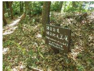
地域内には「鎌倉古道」 が通っています。