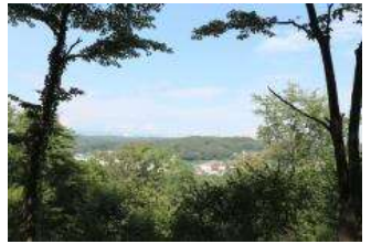
七つの国が見えたことから 「七国山」と呼ばれています。