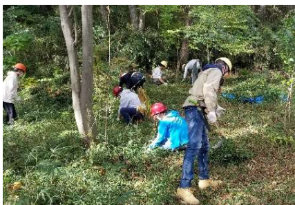
植生豊かな場所にするための、下草刈りを実施します。