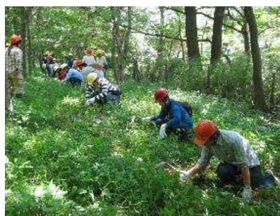
人数が多い時は、エリアごとに分かれて草刈りをします。