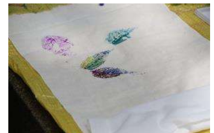
葉っぱ模様のスタンプを押せばオリジナル手ぬぐいの完成です♪