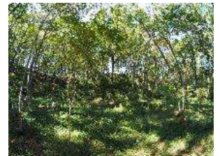
明るい雑木林を目指して、日々活動が続けられています。