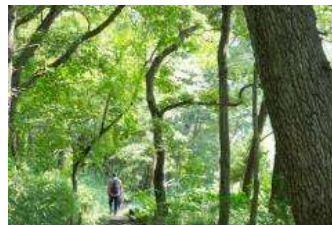
地域内の園路は歩きやすく、自然観察が楽しいですよ。