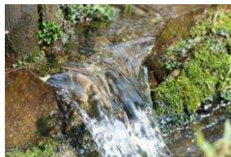
道路際には、ホタルが見られる湧水池があります。