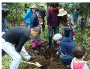
春にはタケノコ掘りも体験できます！