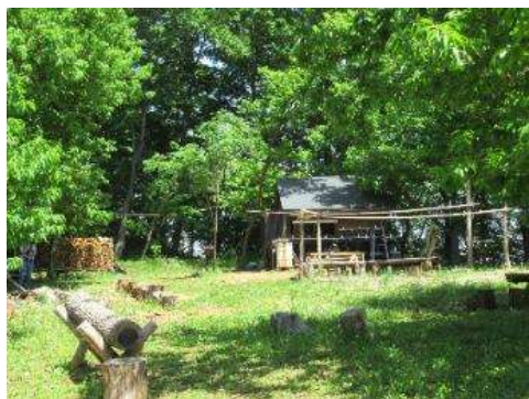
住宅地の中にあり、近隣の方の散歩コースとしても親しまれています。