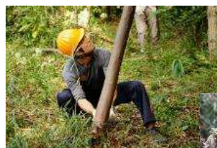
樹木を伐採して薪や炭に活用したり、落ち葉を集めて腐葉土を作ったりします。