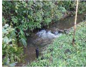
初夏はホタルが見られる湧水です！