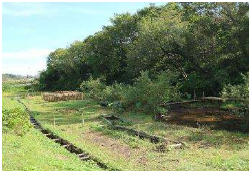
田んぼ、竹林、草地、雑木林、湧水などが一体となった里山です。