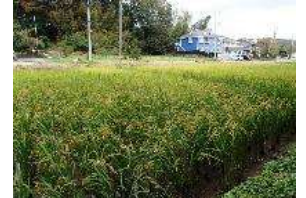
地域内にはボランティア団体によって復元された田んぼがあります。