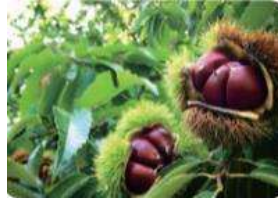
秋は栗が実る栗林もあります♪