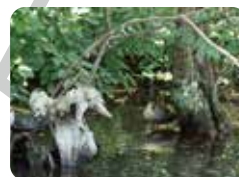
大池 清流広場に隣接する大池です。鯉やカモが多く集まります。