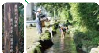
湧水路 「東京名湧水57選」にも選ばれる豊富な湧水が段丘崖のふもとに沿って600mほど流れています。夏場は水遊びができます。