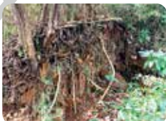
関東ローム層 高さの異なる日野台地と吹上台地からなる地形のため、断面には関東ローム層が間近で見られます。