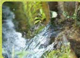
東京の名湧水に選ばれる美しい湧き水