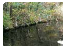
わきみず池 地域中央部にある湧水が湧き出る池です。初夏の頃にはホテルをみるることができます。