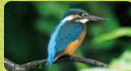
東豊田のシンボルとなっているカワセミ