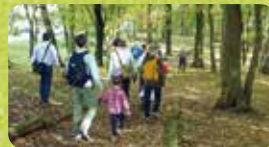
地域の人々が利用する遊歩道