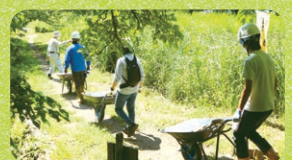
湿地環境の復元活動