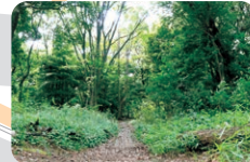
サンクチュアリ 動植物の生息場所になっ ています。