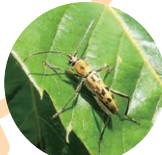
キイロトラカミキリ