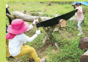
伐採した木の玉切り体験